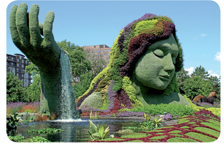
»Mother Earth«, Jacques Cartier Park, Gatineau, Quebec

Eine weitere Bedeutung kommt aus dem Englischen: